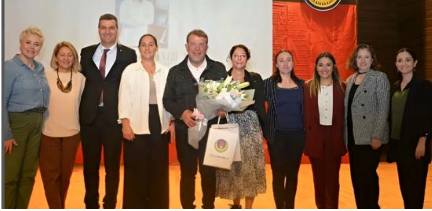
Gazeteci, yazar Nebil Özgentürk Cumhuriyet'in 101. yılında TED Özel Adana Kolejinde Cumhuriyet ve memleket üzerine bir söyleşi gerçekleştirdi.