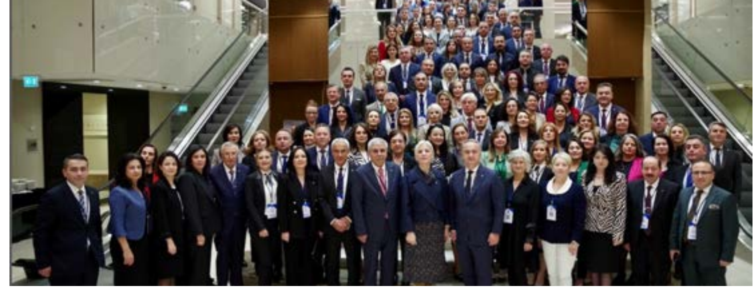
TED Müdürler toplantısı TED Okulları Müdürler Toplantımız, TED Kayseri Koleji'nin ev sahipliğinde gerçekleşti.