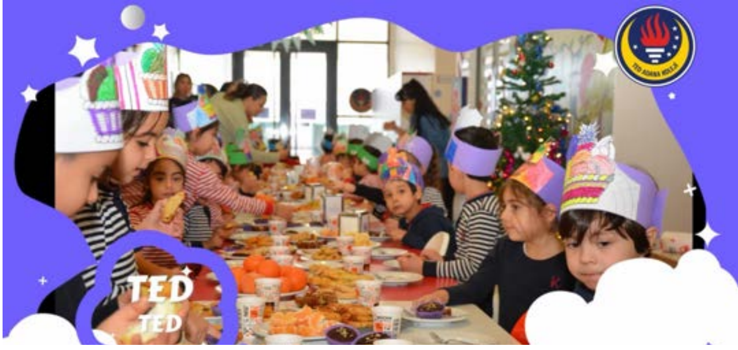
TED Adana Koleji Anasınıfları Yerli Malı Sofrasında