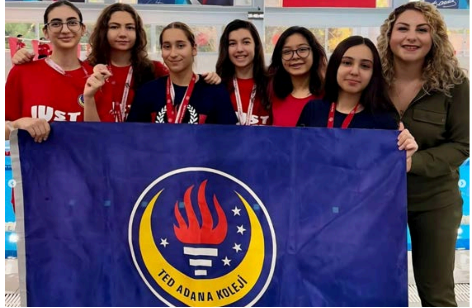
Okullar Arası Gençler Yüzme Kız Erkek Müsabakaları" 16 -17 Aralık tarihlerinde Çukurova Yarı Olimpik Yüzme Havuzunda yapılan Gençler Kız- Erkek Yüzme müsabakalarında,derece almışlardır.