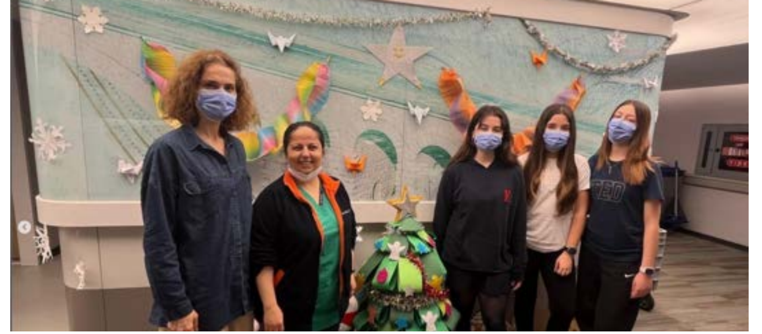
TED Özel Adana Koleji Anadolu Lisesi Görsel Sanatlar Topluluğu öğrencilerimiz, sosyal sorumluluk çalışmaları kapsamında anlamlı bir projeye imza attılar. Acıbadem Hastanesi Çocuk Onkoloji Bölümü'nün koridorlarını, yeni yıl öncesinde el emeğiyle hazırladıkları rengârenk ve neşeli süslemelerle donattılar.