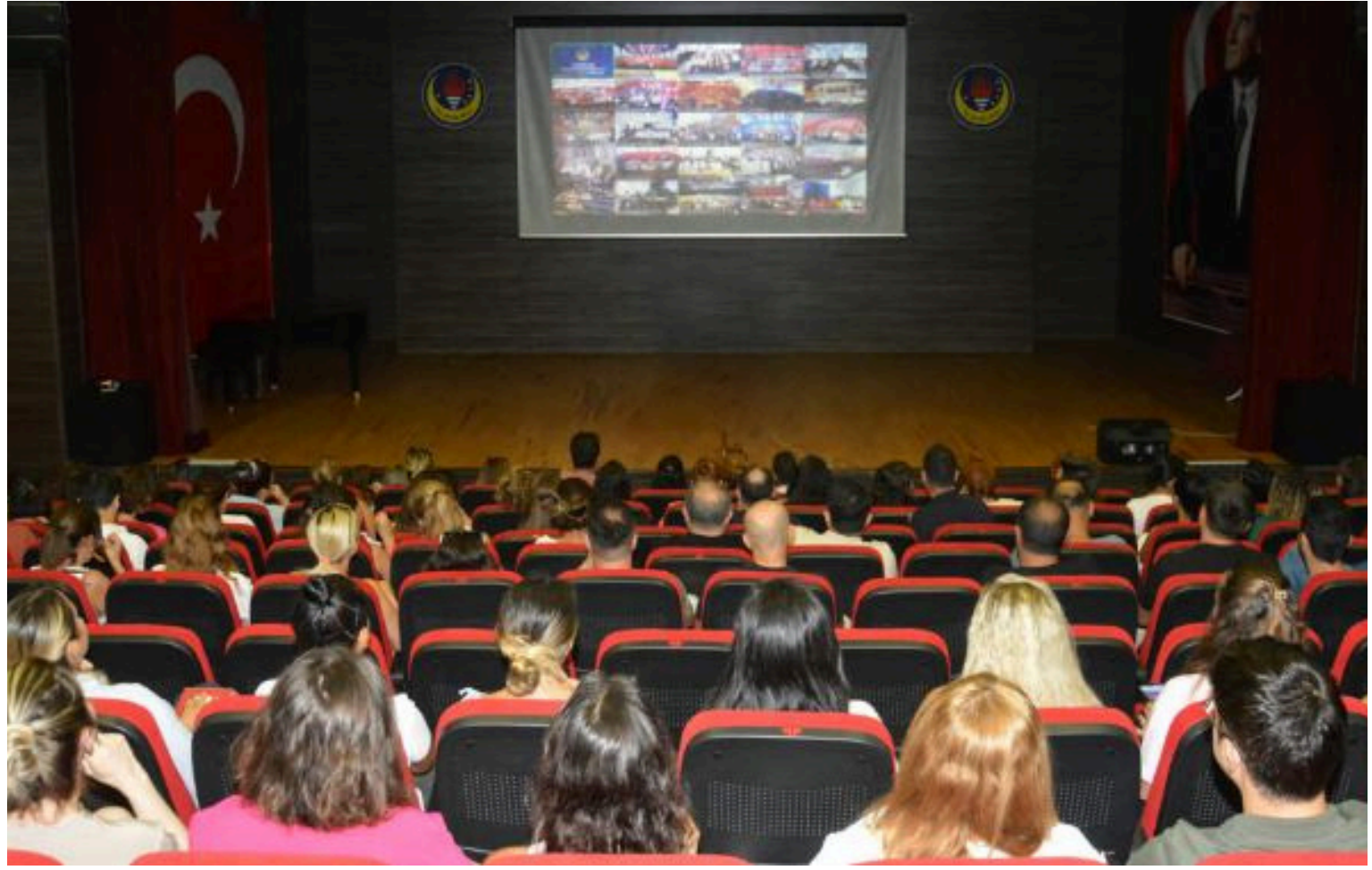
Öğretmenlerimizin mesleki gelişimlerini desteklemeyi her zaman önemseyen Türk Eğitim Derneği Genel Merkezi tarafından Türkiye Yüzyılı Maarif Modeli Öğretim Programları hakkında ortak oturumlarda tüm öğretmenlerimize, paralel oturumlarda ise branşlara yönelik hizmet içi eğitimler düzenlenmektedir. Bu eğitimlerde Türkiye Yüzyılı Maarif Modeli Öğretim Programları hakkında öğretmenlerimiz alan uzmanları akademisyenlerden genel çerçeve ve branşlar bazında detaylı bilgilendirmeler alarak yeni eğitim-öğretim yılına gerekli hazırlıklarını yapmaktadırlar.