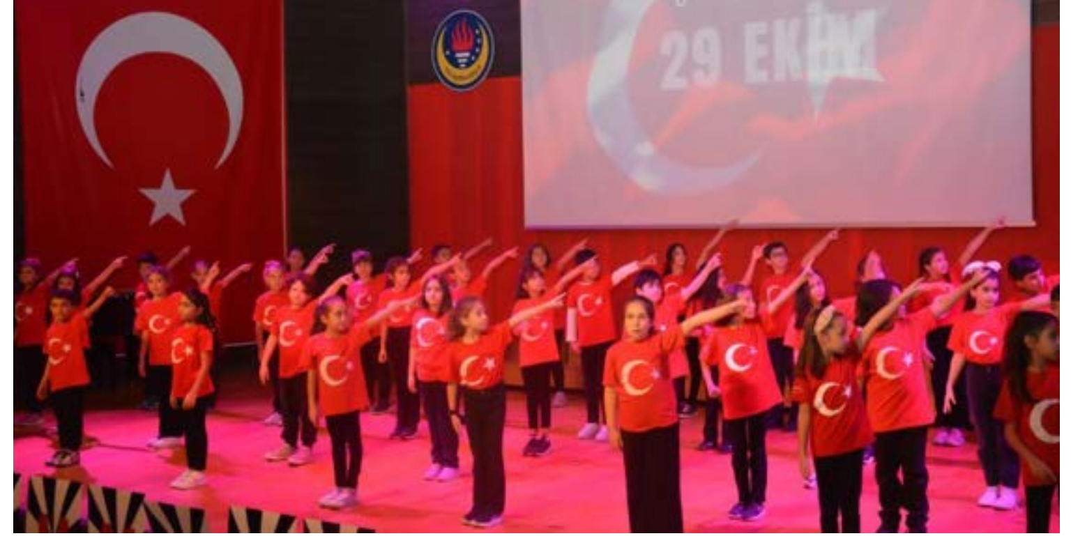
Cumhuriyetimizin 101. Yılıni coşkuyla kutladık.