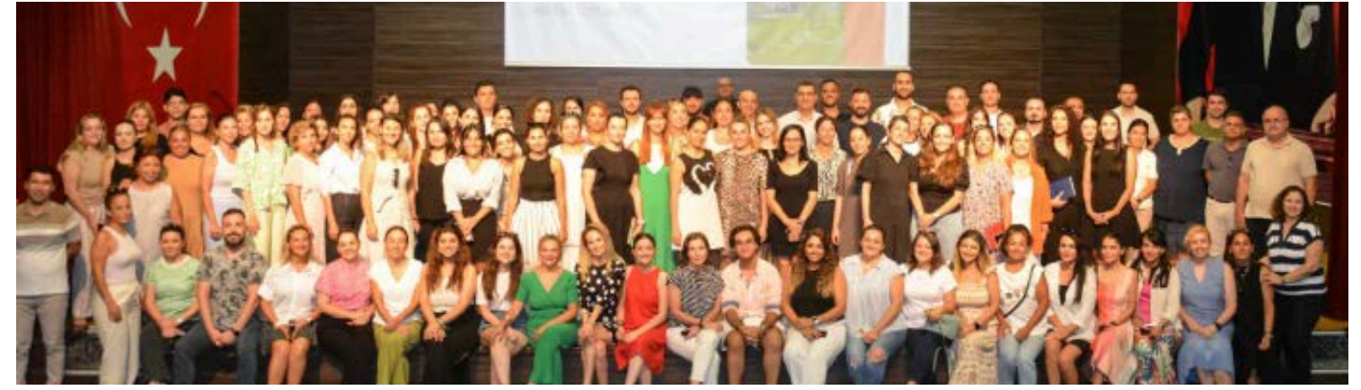
TED Adana Koleji öğretmenleri, 2024-2025 eğitim öğretim yılı