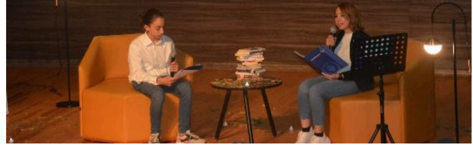
Her yıl düzenlemekten keyif aldığımız şiir dinletimimizde bu yıl, hep "umut" vardı. Şiirleriyle, şarkılarıyla dinletimizi güzelleştiren; umutlarımızı çoğaltan bütün velilerimize, öğrencilerimize teşekkür ederiz.