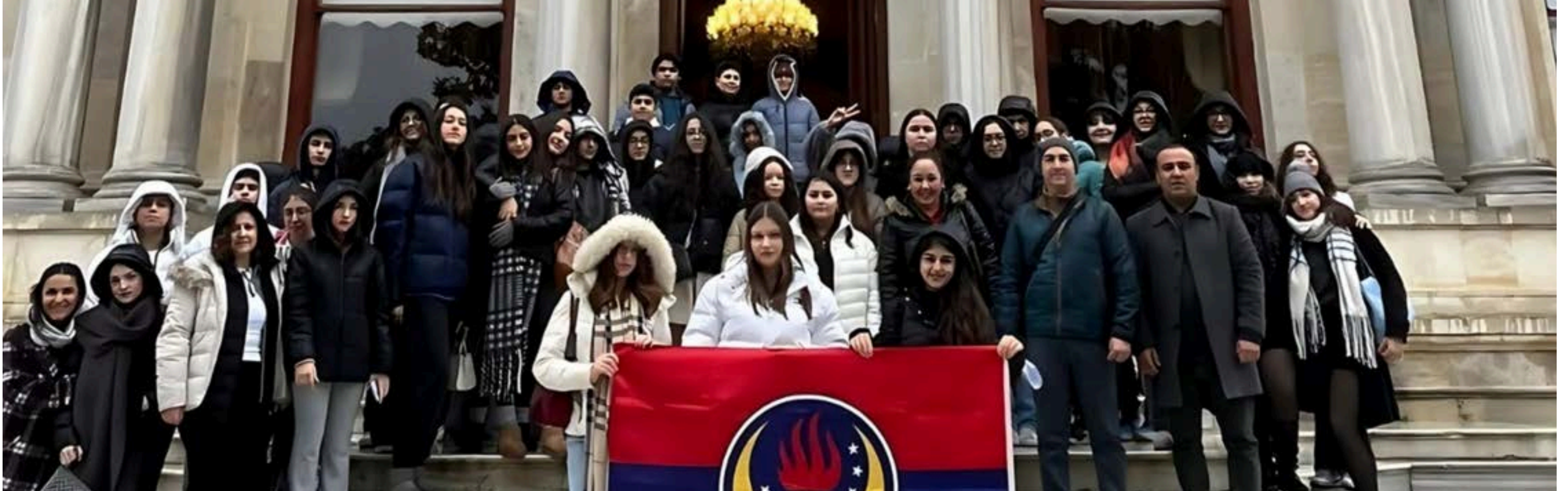
TED Özel Adana Koleji Anadolu Lisesi Sosyal Bilimler Zümresinin 14-15 Aralık 2024 tarihlerinde düzenlediği "Bursa-Uludağ ve İstanbul " gezisi etkinliği 9 ve 10. sınıf öğrencilerinin katılımı ile gerçekleştirildi.