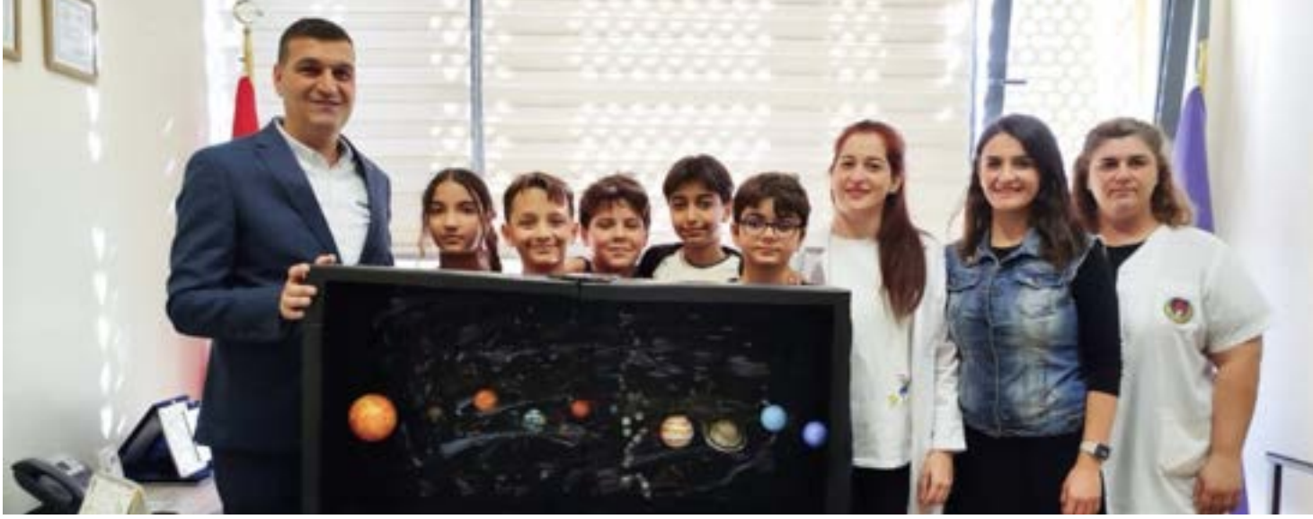
6.sınıflar arasında Fen bilimleri dersinde sınıf içi etkinlik olarak düzenlenen "En İyi Güneş Sistemi Tasarım Yarışması"nı 6/B sınıfı "Einstein" grubu öğrencileri kazanmıştır.