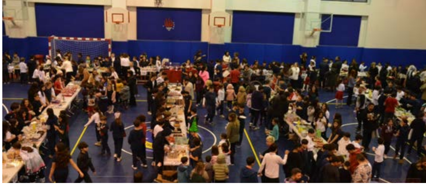
27 Aralık Cuma günü TED Adana Koleji olarak girişimcilik etkinliği düzenledik.