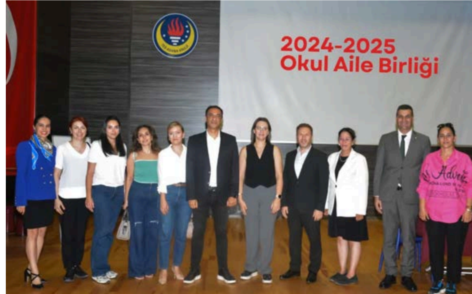
2024-2025 Eğitim Öğretim yılı Okul Aile Birliği seçimimiz yapıldı.