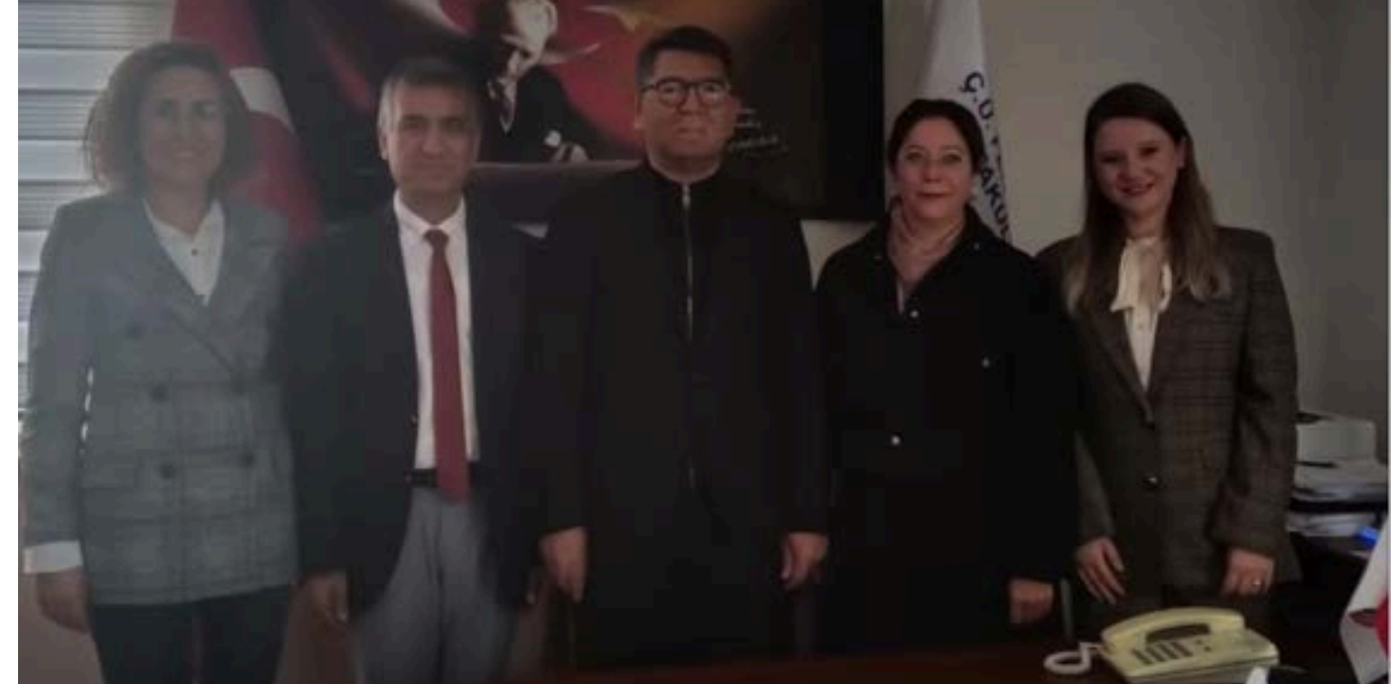
Çukurova Üniversitesi Fen-Edebiyat Fakültesi ile TED Adana Koleji arasında Sosyal ve Bilimsel İşbirliği Protokolü imzalanmıştır.