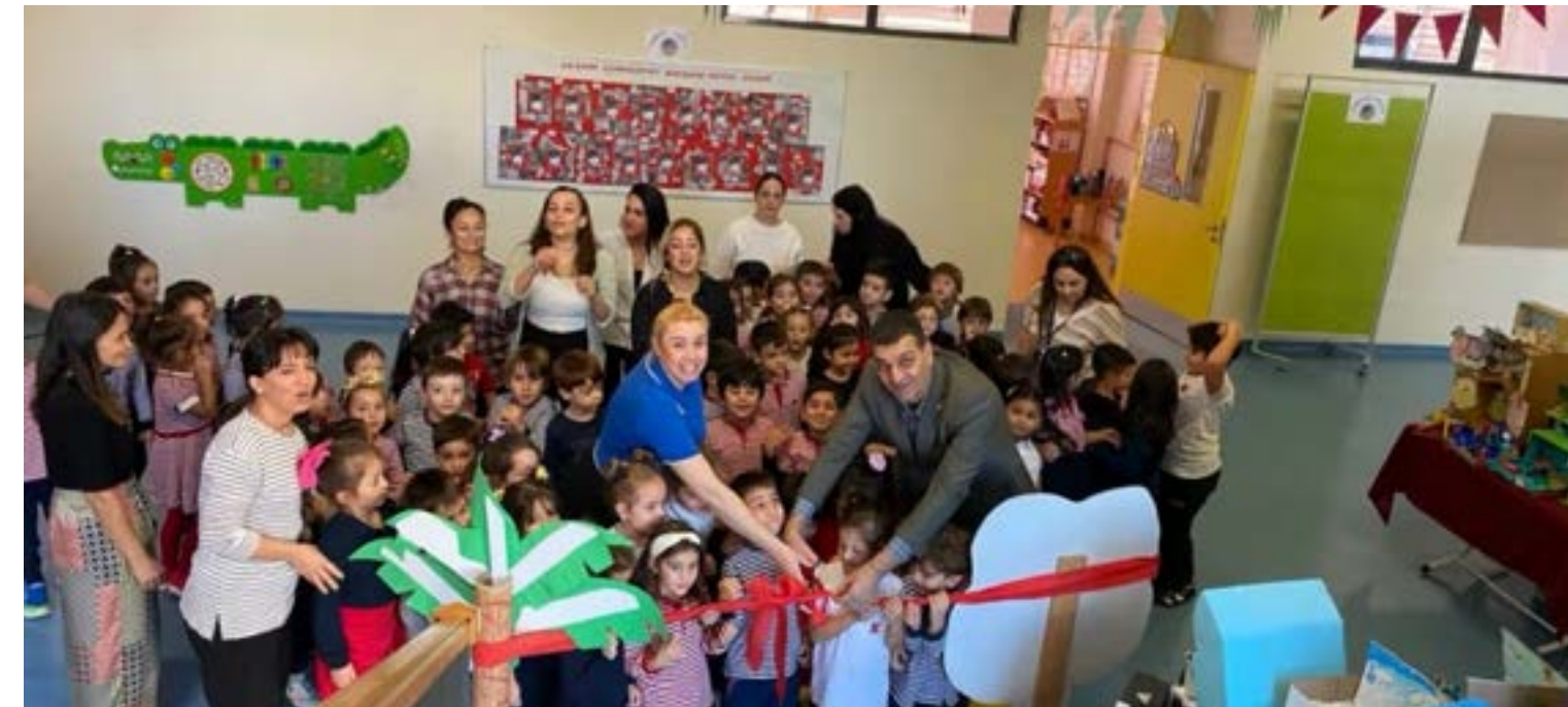
TED Adana Koleji Anasınıflı Öğrencilerinin Eco School Projeleri...

TED Adana Koleji FKB Zümresi; kimya bölümü önderliğinde, öğrencilerle Mol Günü etkinlikleri kapsamında; elde edilen geliri başlatmak amacıyla bir kermes düzenledi. Böylece hem sosyal sorumluluklarını yerine getirdiler