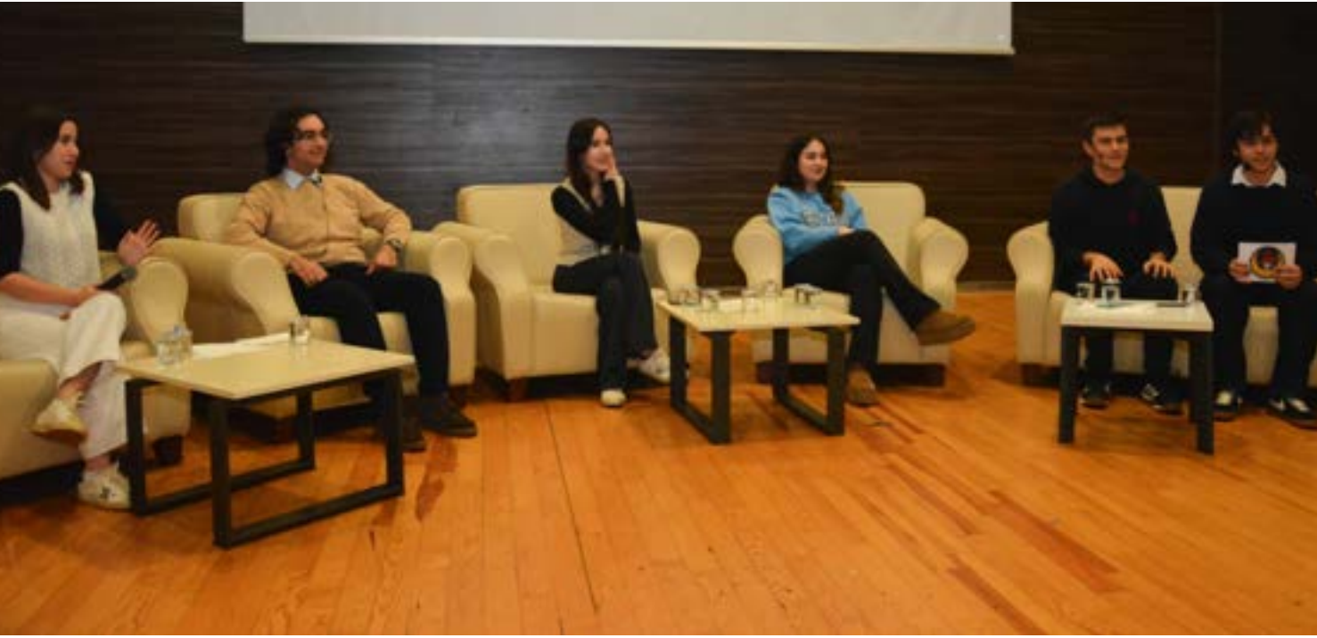
'Mezunlarımız Anlatıyor' etkinliğinde, mezunlarımız kardeşleriyle bir araya geldi.