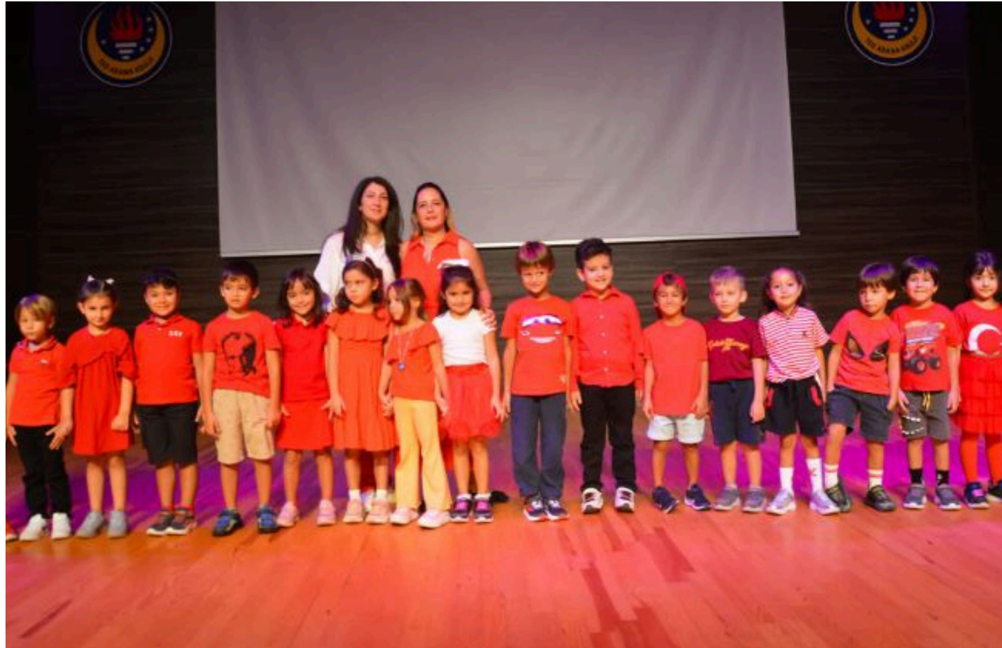
Hayallerimiz gibi bizde rengarenk TED Adana Koleji anasınıfları geleneksel Renklerle Tanışma partisinde çok eğlendik. Beyaz gibi temiz, mor gibi bereketli, yeşil gibi sağlıklı, mavi gibi huzurlu, kırmızı gibi heyecanlı, sarı gibi sıcak ve tabiki hep beraber gökkuşağı gibi uçsuz bucaksız hayallerimizi yaşayacağımız bir yıl olsun.