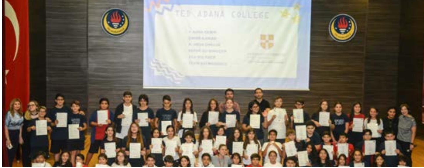
Cambridge English Young Learners, KET ve PET sınavlarına giren ilkokul ve ortaokul öğrencilerimize, sertifikalarını kendileri için düzenlenen bir törenle takdim ettik.