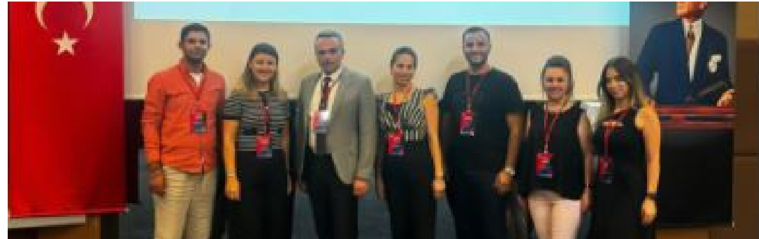
TED Genel Merkez Ölçme Değerlendirme Birimi tarafından 22-24 Ağustos 2024 tarihlerinde "Lise Kademesi Sınav Komisyon Çalışmaları 9. Çalıştay"ı ve "İlkokul-Ortaokul Kademesi 12. Çalıştay"ı düzenlendi.