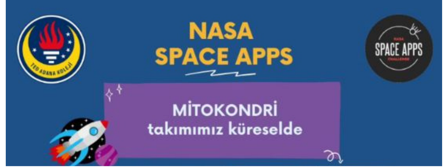
TED Adana Koleji öğrencileri, 11 takım halinde 11 proje ile NASA Space Apps Challenge yarışmasına katılmıştır. Jüri değerlendirmesi sonucunda, ülkemizi küresel çapta temsil edecek 10 takım arasında yer alan Mitokondri takımımız