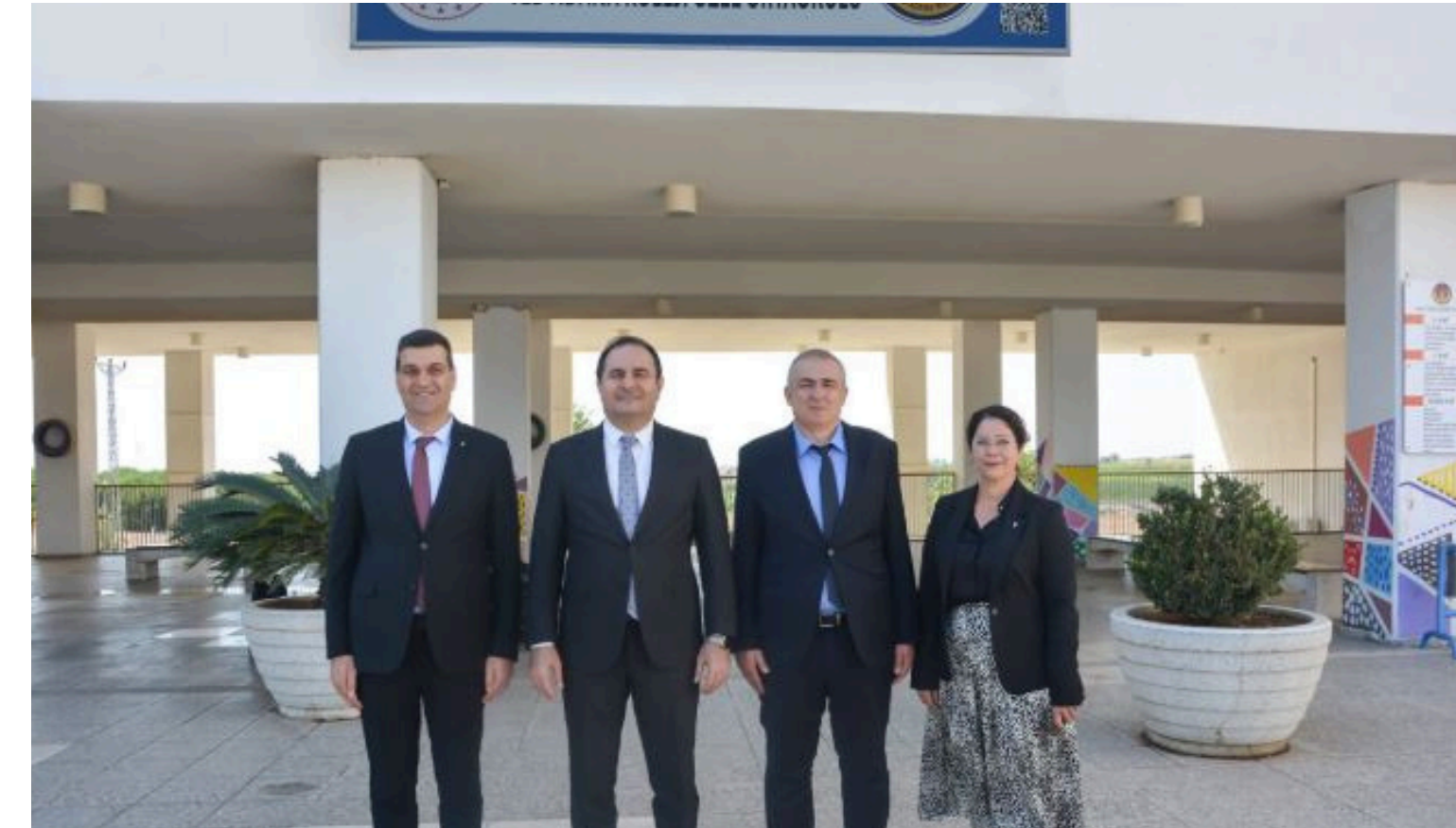
TED Adana Koleji Anasınıfları Renk Partisinde , Hayallerimiz gibi bizde rengarenk TED Adana Koleji anasınıfları geleneksel Renklerle Tanışma partisinde çok eğlendik.