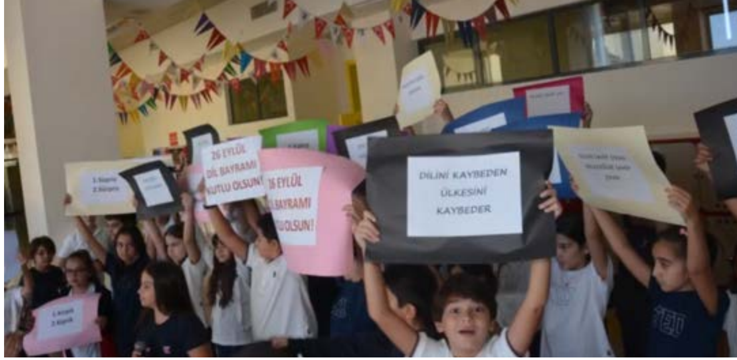
26 Eylül Dil Bayramı'nın 92.yıl dönümü kutlu olsun!