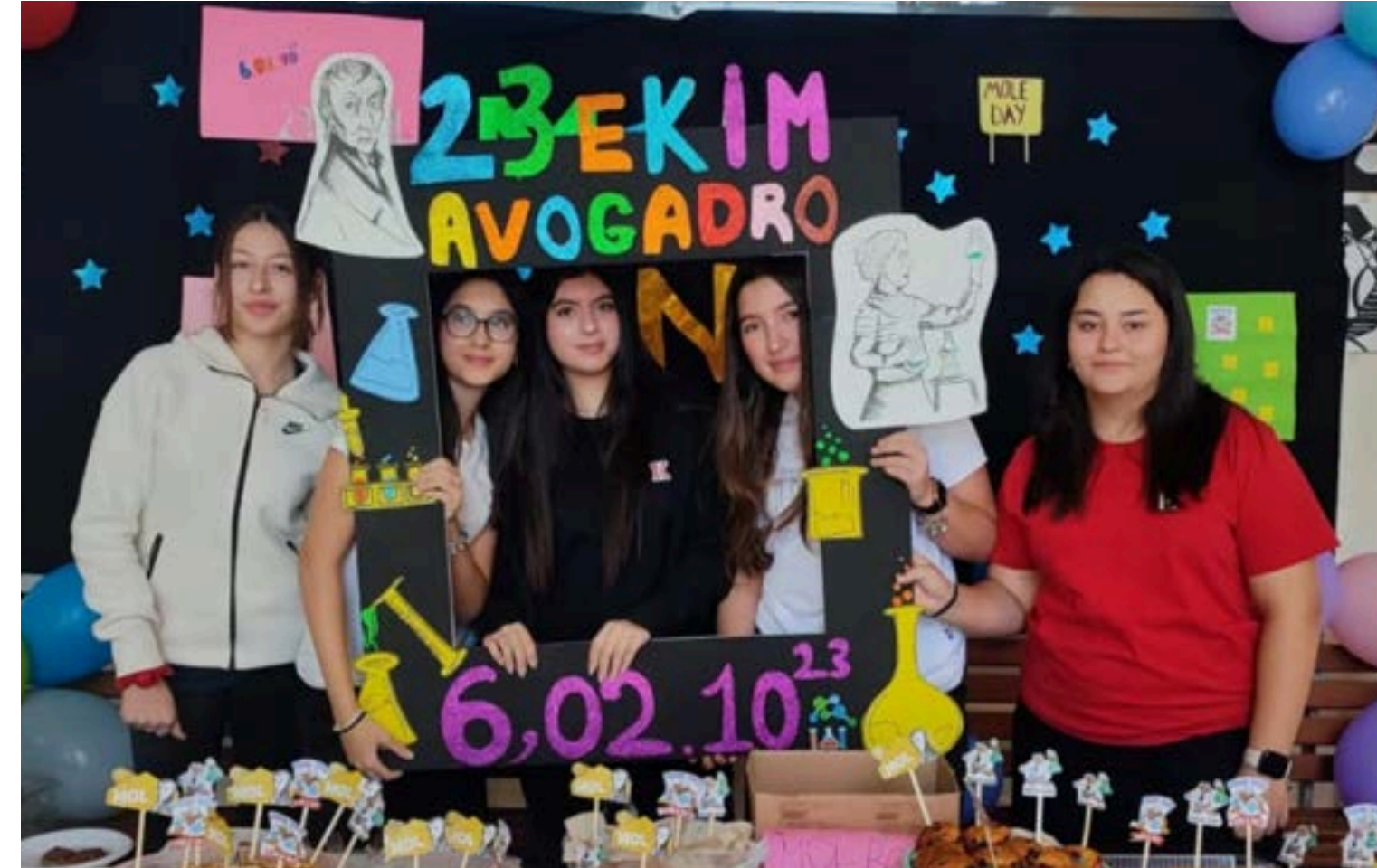
23 Ekim, tüm dünyada Amedeo Avogadro'nun uzun yıllar yaptığı çalışmalar sonucunda keşfettiği ve kendi soyadıyla anılan "Avogadro Sayısı Günü" olarak anılmaktadır. Bu sayı kimya biliminde önemli bir birim olan 'mol' kavramını tanımlar ve birçok önemli hesaplamada kullanılır.

TED Adana Koleji FKB Zümresi; kimya bölümü önderliğinde, öğrencilerle Mol Günü etkinlikleri kapsamında; elde edilen geliri başlatmak amacıyla bir kermes düzenledi. Böylece hem sosyal sorumluluklarını yerine getirdiler