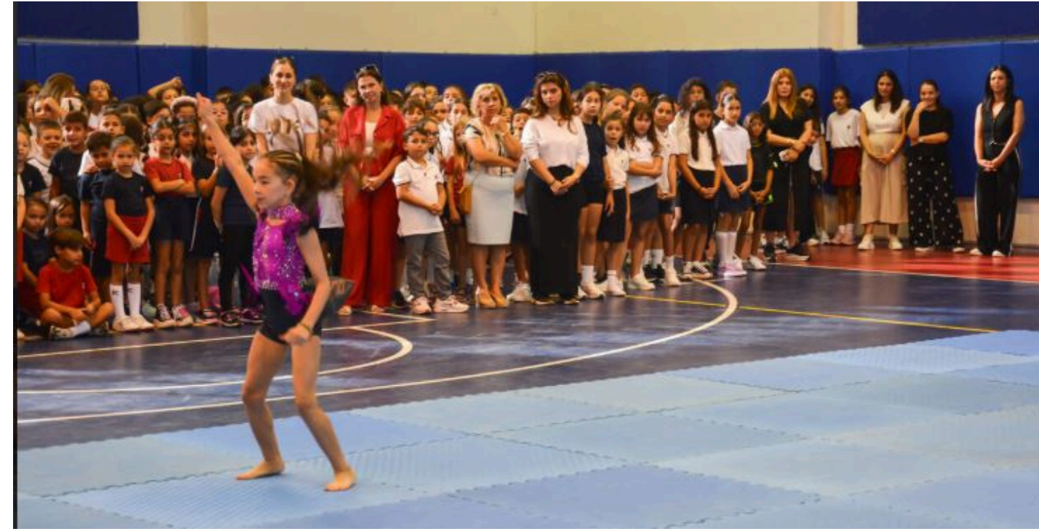
2024-2025 Eğitim Öğretim Açılış Günü